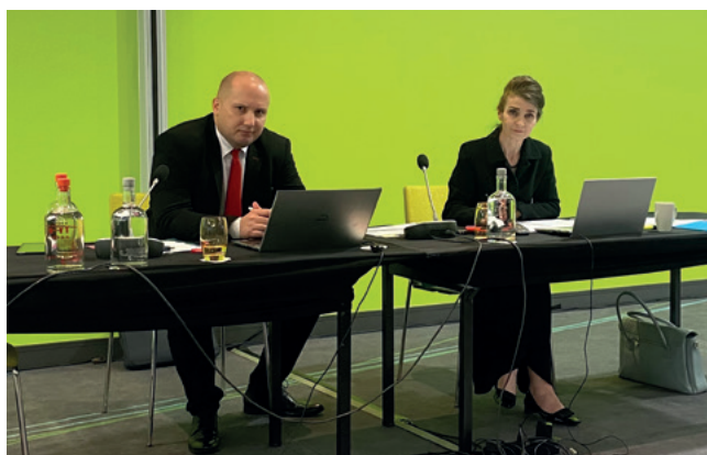
Posiedzenie Komitetu EA ds. Inspekcji w Brukseli (21-22 września)