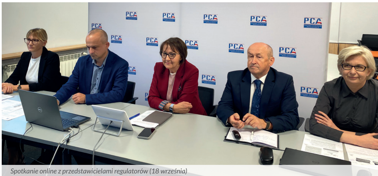
Spotkanie online z przedstawicielami regulatorów (18 września)